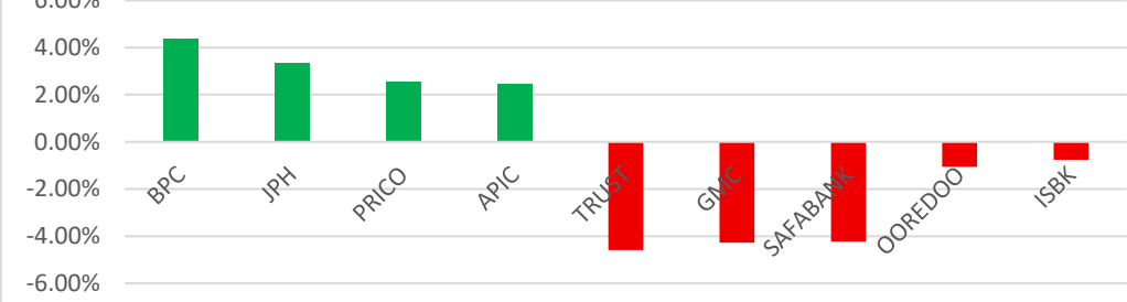
الشركات اكثر انخفاضا وارتفاعا